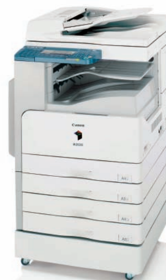
Abbildung mit optionalem Zubehör

e-Maintenance - ein Wartungssystem, das mögliche Störungen bereits im Vorfeld erkennt und den Servicetechniker darüber informiert. Fragen Sie Ihren Canon Partner!